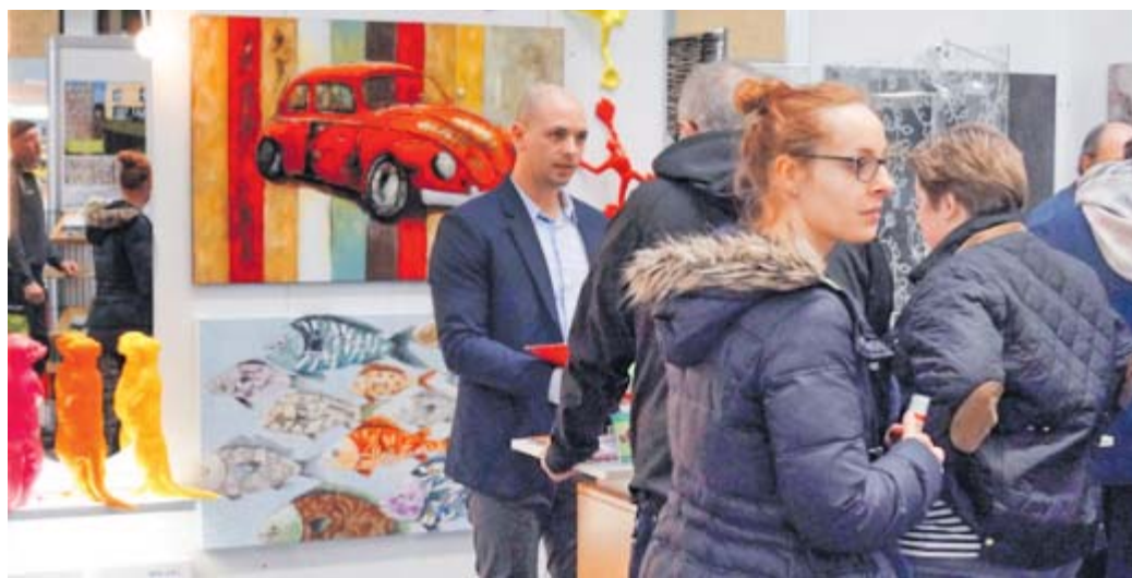
Geballte Kompetenz: Die Aussteller informieren die Besucher ausführlich zu allen Immobilien Themen. Fachvorträge ergänzen das Angebot.