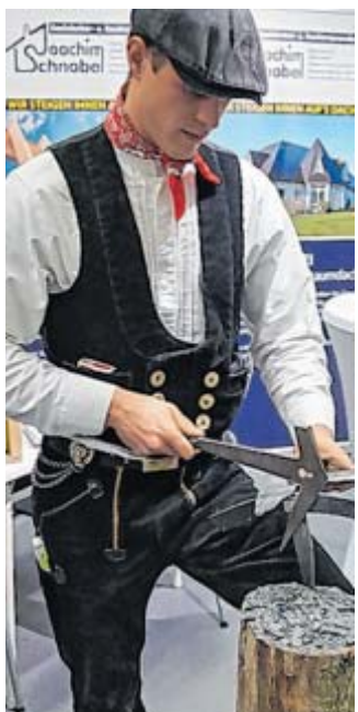
Interessant: Besucher können Handwerker zuschauen.